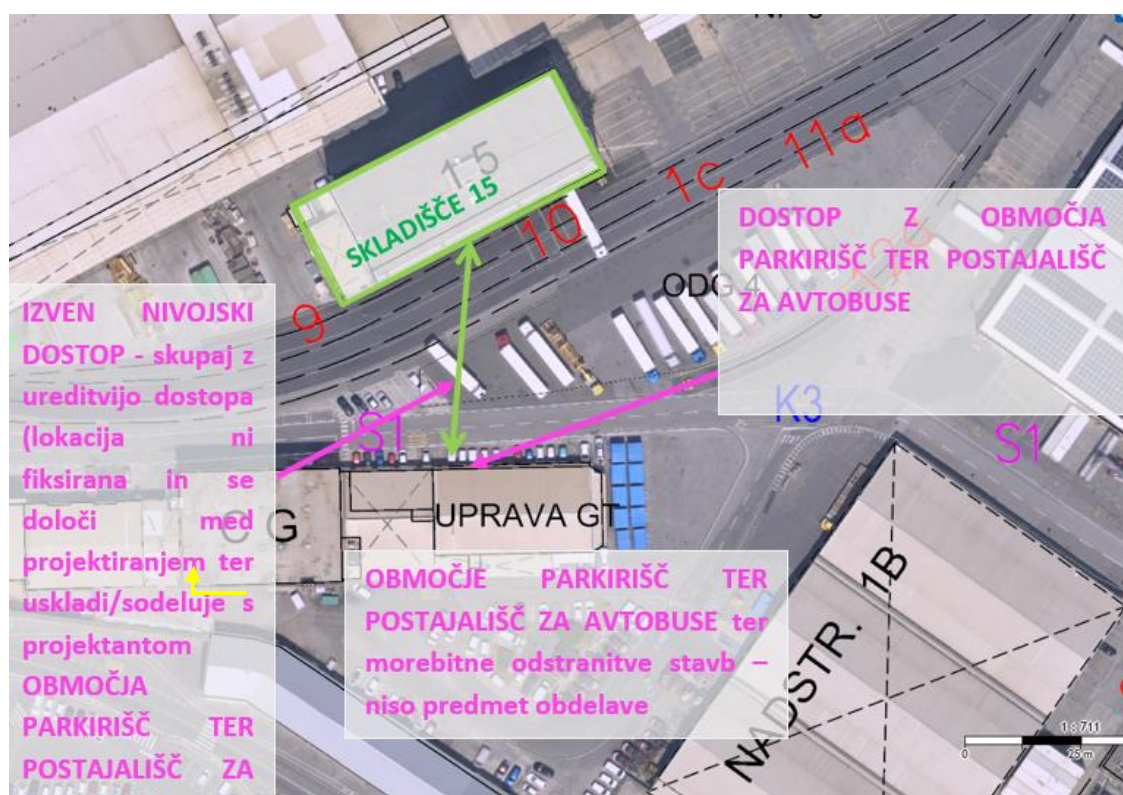
Slika 1: Lokacija objekta Skladišče 15 s prometno ureditvijo okoli skladišča, predvideno območje izven nivojskega dostopa (točno lokacijo predvidi projektant glede na zasnovo objekta).

Lokacije predvidenih posegov so prikazane na spodnji sliki.